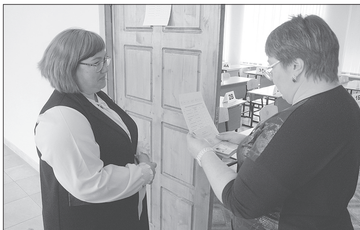
Вход в аудиторию только по паспорту