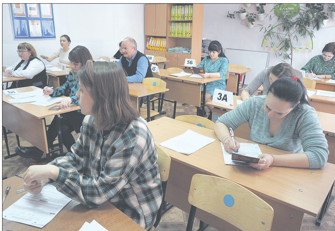
Свои знания по русскому языку проверили тринадцать взрослых

Родители выпускников «сдали» единый государственный