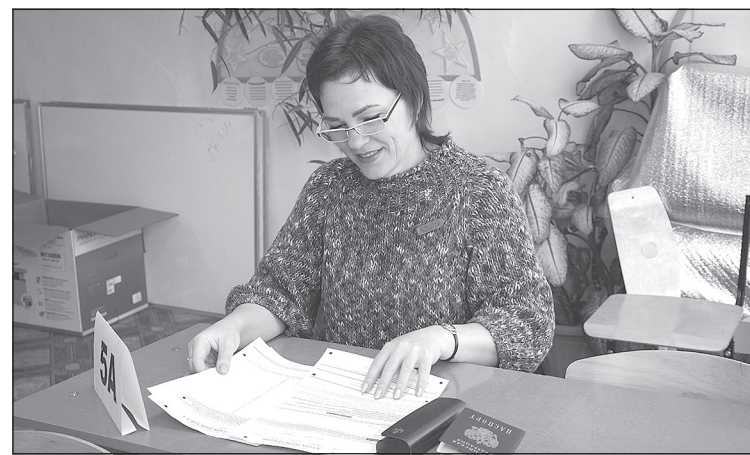
На выполнение заданий взрослым дается час